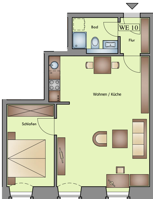
Wohnung 10 M 1:100